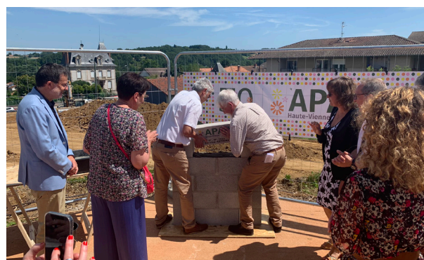
Le Maire d'Aixe-sur-Vienne et le Président de l'association sont à l'oeuvre