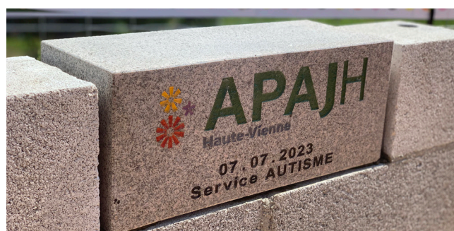
La première pierre posée