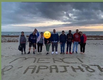
Profiter du sable pour faire passer un message