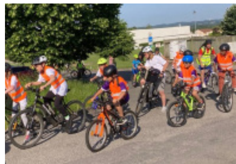
Les environs de St-Just-le-Martel ne sont pas plats !

Maintenant que le chemin est tracé, il n'y a plus qu'à recommencer l'an prochain.