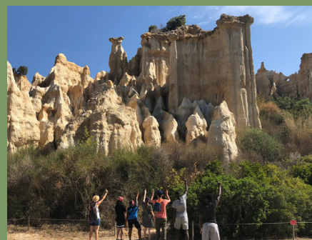
Petite balade à Ille-sur-Têt et découverte des orgues