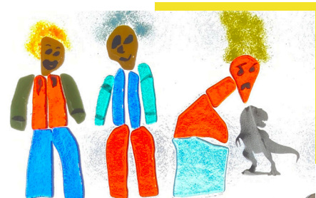
L'une des œuvres des jeunes

Pas loin de 200 personnes – partenaires et invités, parents, camarades de l'IME, administrateurs mais aussi touristes voulant admirer l'intérieur du pavillon, ont ainsi apprécié pendant 3 jours, le résultat de la fusion des matériaux et des énergies individuelles et collectives, sous l'œil attentif de l'émailleuse Marine Bidoux et de Cécile Desmousseau, l'enseignante.