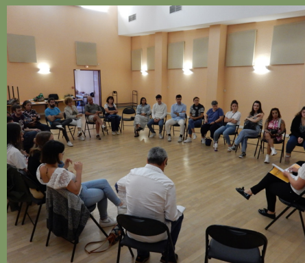
La journée bilan annuelle avec les animateurs