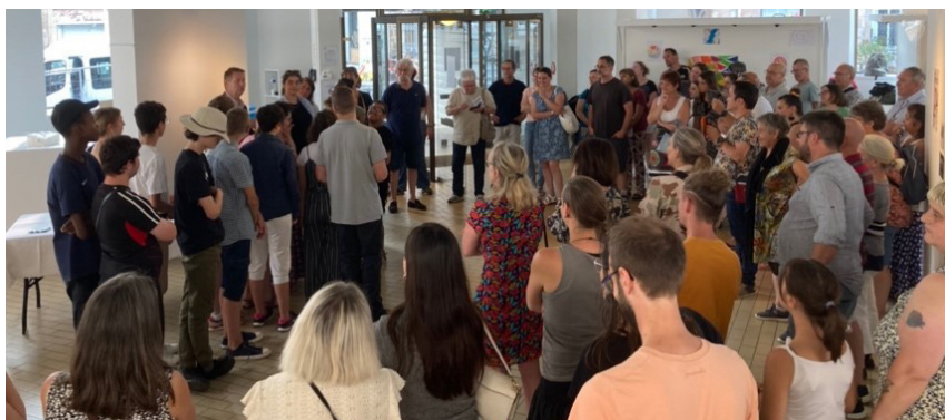
Beaucoup de monde au vernissage le 27 juin