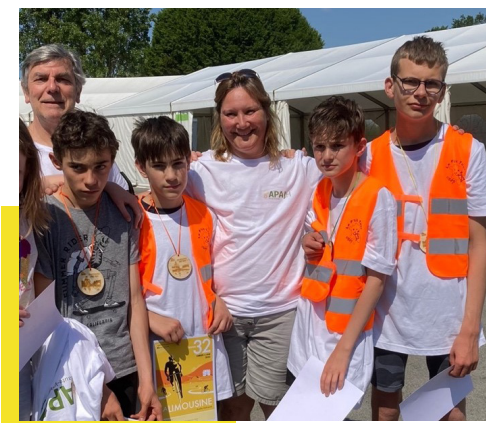
Photo finish des participants avec médaille et diplôme