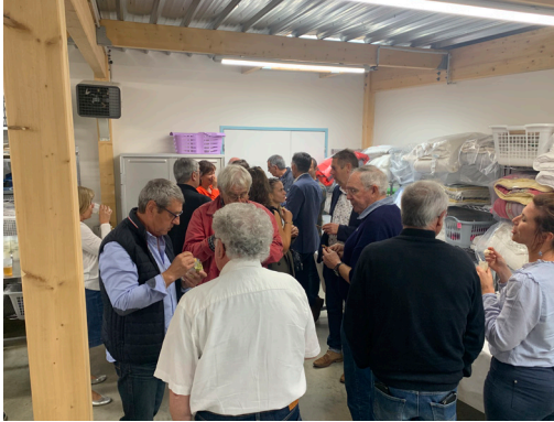
Temps convivial lors du repas de fin d'été de l'Entreprise Adaptée

L'activité de l'Entreprise Adaptée a été marquée en 2023 par l'ouverture rapide d'une nouvelle blanchisserie à Châteauponsac. Une étape clé dans la vie de l'EA ! Les deux salariées recrutées ont à cœur d'accueillir les clients et de répondre à leurs besoins. L'activité principale se maintient avec le contrat de l'éhpad, en espérant développer l'activité sur l'année 2024 avec de nouveaux clients industriels. Cependant, le chiffre d'affaires des particuliers est en constante augmentation, ce qui augure une bonne année 2024.