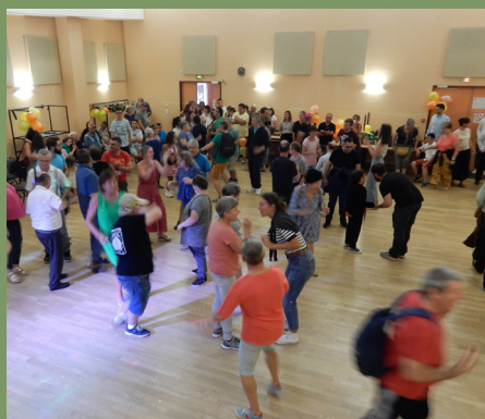
C'est la fête lors de la journée bilan avec les vacanciers et les animateurs