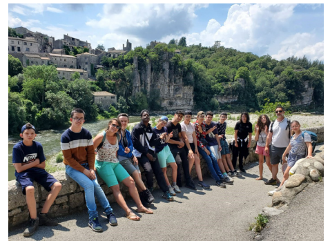
Pas encore les vacances au bord de l'Ardèche, mais presque ...

Ce séjour fût aussi l'occasion de découvrir la région : Vallon Pont d'Arc, la grotte Chauvet (avec un atelier « Chasse Préhistorique »), Balazuc, classé dans les « Plus Beaux Villages de France » ou encore une petite randonnée autour des Gorges de l'Ardèche.