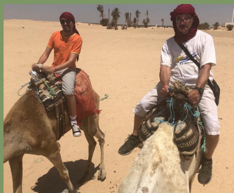
Séjour à Djerba en Tunisie avec une balade en dromadaire