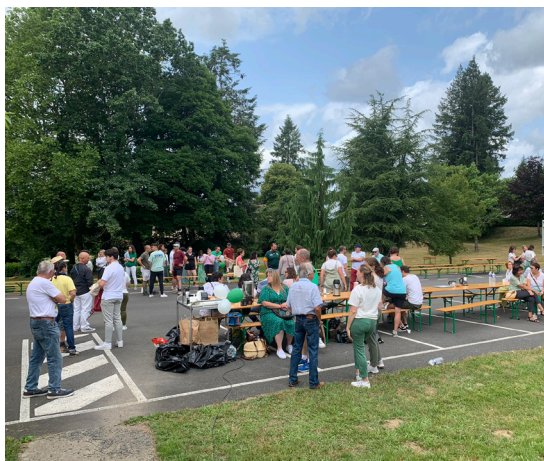
Les professionnels discutent autour d'un café

L'APAJH Haute-Vienne souhaite remercier les professionnels qui ont assuré la continuité de l'activité durant ces évènements.