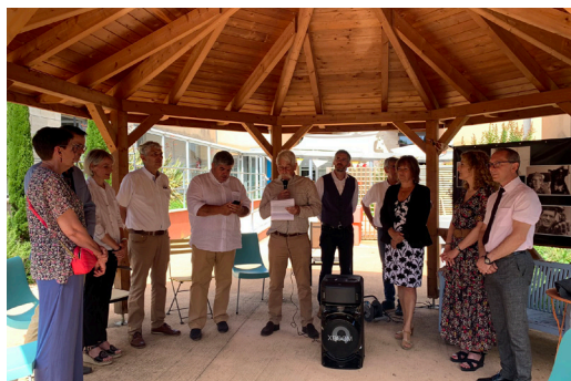
Les intervenants prononcent leurs discours

En juillet dernier, le projet de construction de l'unité autisme sur le site de la MAS s'est concrétisé avec la pose de la première pierre symbolique marquant le début des travaux. Pour rappel, ce bâtiment permettra d'augmenter la capacité d'accueil en internat et en accueil de jour dans l'objectif de répondre aux besoins du territoire et proposer des solutions diversifiées d'accompagnement grâce à un aménagement adapté des locaux.