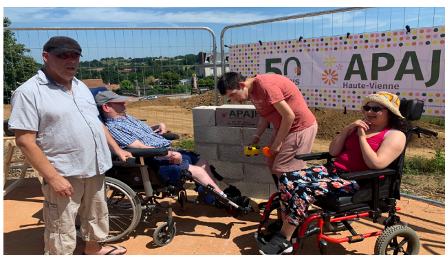
Les résidents de la MAS viennent admirer cette première pierre

Nos remerciements à notre architecte, notre assistant à la maîtrise d'oeuvre, aux entreprises impliquées dans ce projet et aux partenaires pour leur présence et leur soutien.