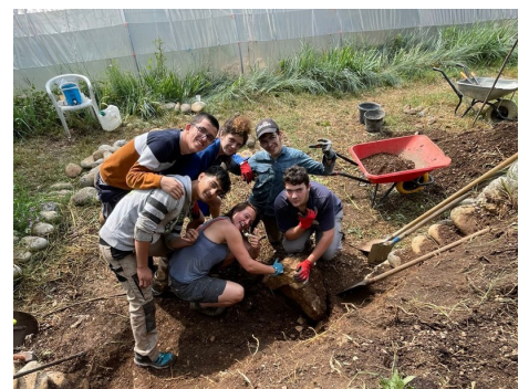
C'est au pied du mur qu'on voit les maçons