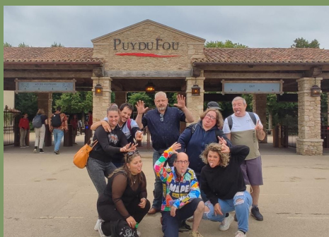
À la découverte du Puy du Fou et de ses spectacles