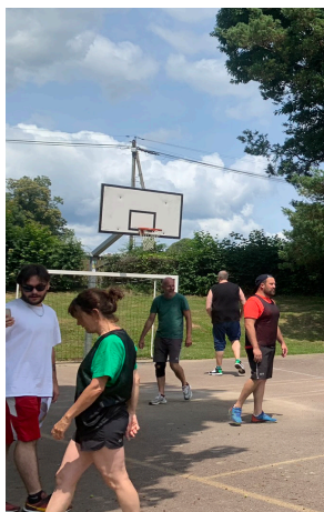
Le tournoi de basket