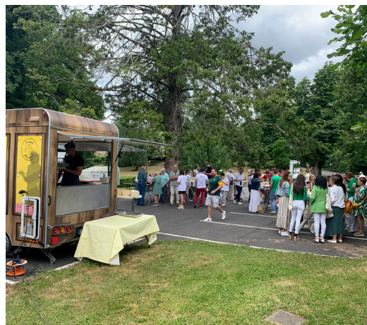
Dégustation d'un repas concocté par le food truck Chez René