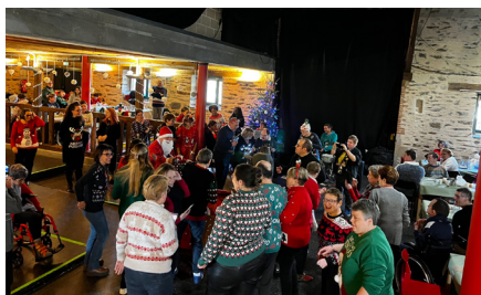
Ambiance festive lors de l'arrivée du Père Noël...