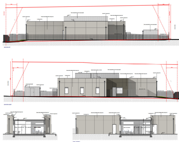
Les plans 3D de l'Unité Résidentielle

La construction, située à 500 mètres de la MAS d'Aixe-sur-Vienne sur un terrain offert par la municipalité, devrait être achevée à l'été 2026.