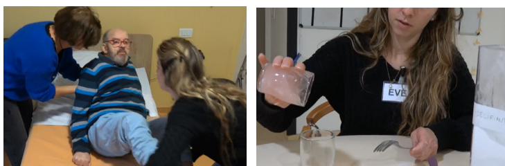
Techniques filmées : installer dans un lit, gélifier les liquides.

Un grand merci au personnel de l'EPHAD pour son accueil et aux résidents, acteurs d'un jour !