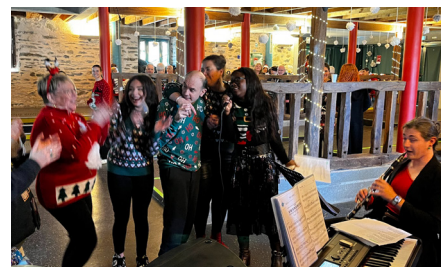
... Mais aussi tout au long de la journée !