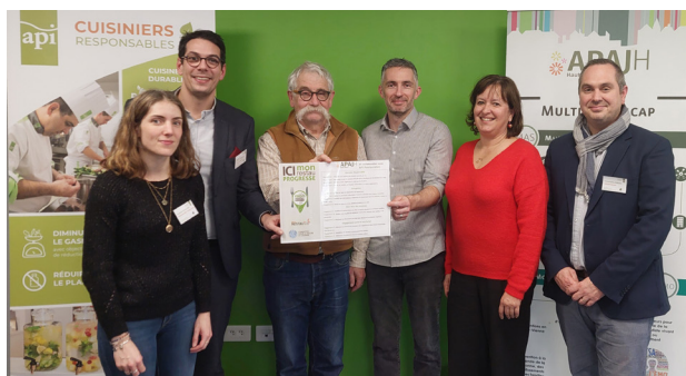
Les équipes d'API, de Mon Restau Responsable et de l'APAJH Haute-Vienne.

Cette belle dynamique de progrès mobilise l'ensemble de l'équipe et en particulier le service de restauration collective API, partenaire de la MAS pour la gestion des repas.