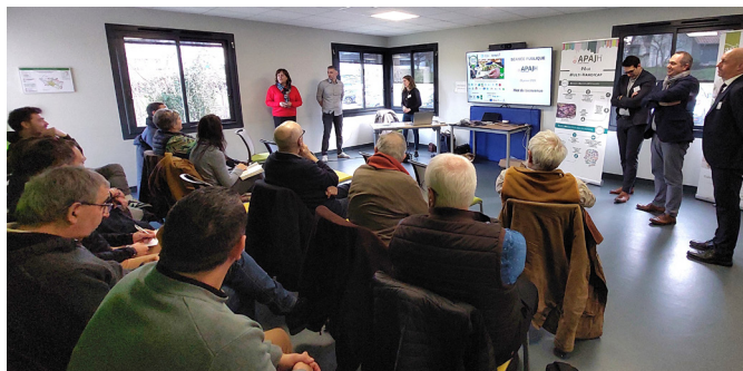
Familles, administrateurs et partenaires étaient présents.