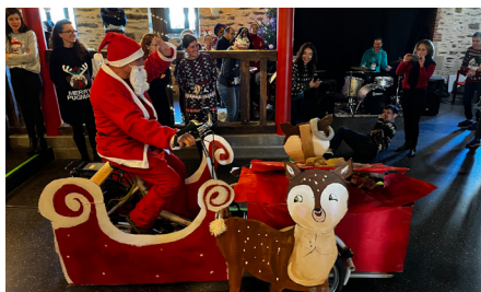
Le traîneau réalisé à l'aide des vélos pousseurs.

Les résidents ont célébré les fêtes de fin d'année entourés de leurs familles et des équipes, dans une ambiance chaleureuse. Au programme : un délicieux repas, des chants festifs et une magnifique décoration. Le moment fort ? L'arrivée surprise du Père Noël sur un traîneau plus qu'original pour distribuer les cadeaux ! Bravo aux professionnels pour cette belle organisation.