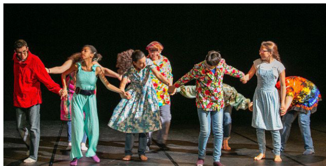
Les changements de postures se sont enchaînés au fil de l'histoire.

Avec beaucoup d'engagements, les jeunes ont transformé leur forêt imaginaire en espace de liberté.